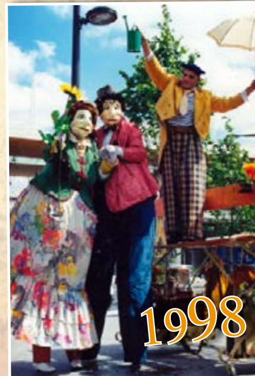
Piano Piano se va lontano