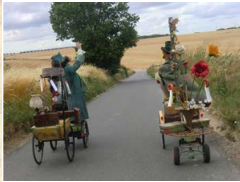
Les Passeurs de rêves